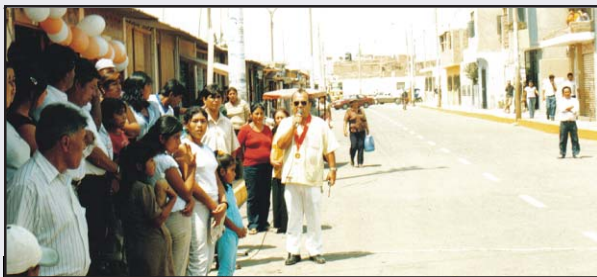
Calle Lopéz Alburjar Pavimentación Flexible y alcantarillado de la primera cuadra, principal vía de acceso al Museo Señor de Sipan, presupuesto 51727 nuevos soles.

Cuando se desea realizar la Pavimentación de una Calle, Avenida, Local Comunal o cualquier otra Obra, Los Moradores se organizan en comité de gestión y hacen llegar sus pedidos y proyectos a la Municipalidad, prueba de ello son estas Obras que son una consecuencia de la Organización.