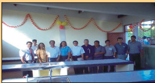
Construcción de Aula y Gabinetes de física en la I. E. Cristo Rey de Motupe; la inversión fue de 35876 soles