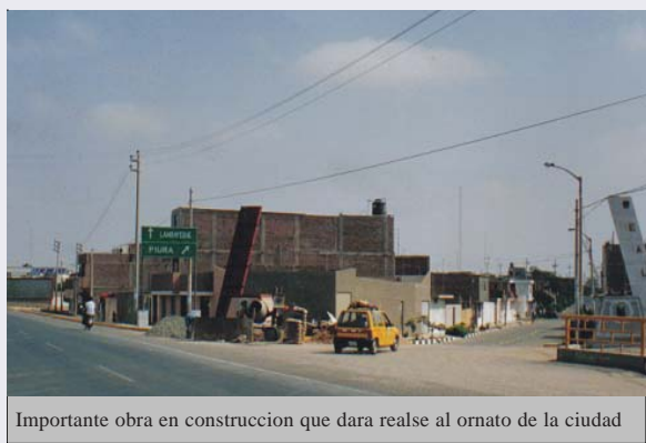
Importante obra en construcción que dara realse al ornato de la ciudad

Esta obra contempla en el expediente técnico 5 subproyectos; el primero es la construcción de un portal al inicio de la calle Pedro Ruiz Gallo, habilitando un acceso directo al Museo Nacional Tumbas Reales del Señor de Sipán.