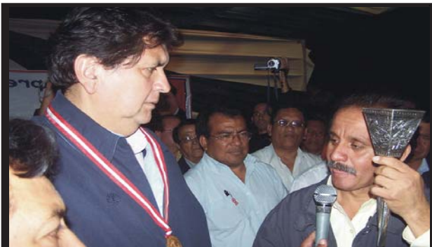
ALAN GARCIA INAUGURO HISTORICA OBRA DE ILUMINACION EN PUNTO CUATRO