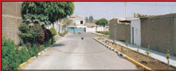
CALLE MATEO PUMACAHUA