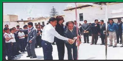
Reconstrucción de la Loza Multideportiva ubicada en el colegio 27 de diciembre.

Todos estos servicios se realizaron como complemento al mejoramiento del campo deportivo que consistió en cavar 30 centímetros de profundidad para luego colocar una capa de cal que controle el salitre existente en la zona, también se colocó otra capa de arena de río y finalmente se agregó tierra de cultivo donde se sembró grass, adicionalmente se ha construido una cisterna para el almacenamiento de agua, asimismo una pista atlética y la adquisición de un moderno vehículo cortador de grass, los trabajos que se han realizado ascienden a un costo de 442 mil nuevos soles en total.