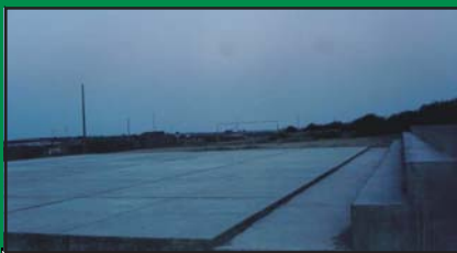
Construcción de loza Multideportiva en los Angeles ubicada en el PP.JJ. Santa Rosa