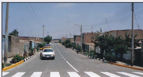
Calle Kennedy comprende la instalación previa de la red troncal de tuberías matrices que suministraran agua potable al AA.HH. Las Dunas y Pavimentacion Flexible en las cuadra 3 y 4; la inversion Municipal es de 127 679 nuevos soles.