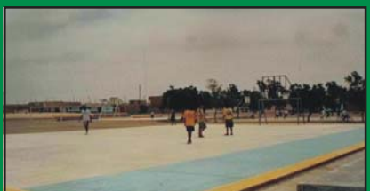
En el complejo San Juan Masías se han concluido 2 lozas multideportivas.

Todos estos servicios se realizaron como complemento al mejoramiento del campo deportivo que consistió en cavar 30 centímetros de profundidad para luego colocar una capa de cal que controle el salitre existente en la zona, también se colocó otra capa de arena de río y finalmente se agregó tierra de cultivo donde se sembró grass, adicionalmente se ha construido una cisterna para el almacenamiento de agua, asimismo una pista atlética y la adquisición de un moderno vehículo cortador de grass, los trabajos que se han realizado ascienden a un costo de 442 mil nuevos soles en total.