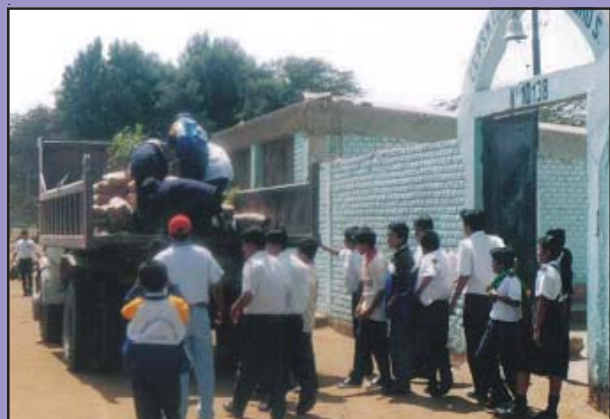
Donación de materiales para el acondicionamiento de la I.E. y la rehabilitación de la Plataforma Deportiva realizada por la MPL.