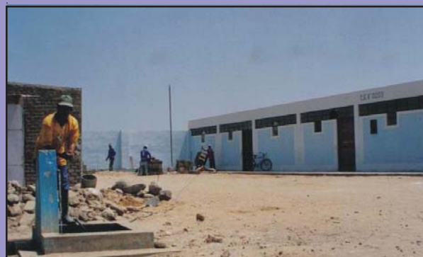
Vista fotográfica de una de las Piletas instaladas en la Institución Educativa 11209, que abastecen del líquido elemento a los trabajadores que realizan faenas de refacción que son financiados por la MPL.

Adicionalmente, se rehabilitó las vías de comunicación que conectan al caserío con la Panamericana Norte; otro donativo se realizó al I.E. consistente en puertas y ventanas así como su acondicionamiento.