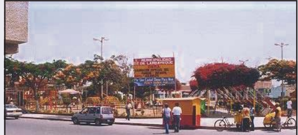
El Tradicional Parque Infantil de Lambayeque ha sido acondicionado se han agregado novedosos juegos recreativos y se ha incorporado un nuevo sistema de iluminación; la inversión es de 85 852.93 nuevos soles.