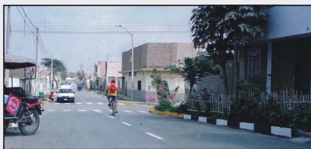
Calle Tupac Amaru situada en el PP.JJ. Santa Rosa en donde se han Pavimentado las cuadras 4 y 5 adicionalmente se han construido sardineles para mejorar el ornato, la inversion es de 135 mil nuevos soles.