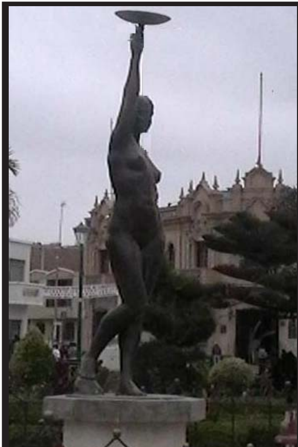
LA ESTATUA DE LA LIBERTAD, MAS CONOCIDA COMO LA VENUS FUE DONAMDA POR EN EL GOB. DE A. LEGUIA