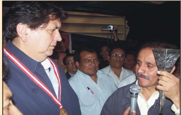
Alcalde Percy Ramos hace entrega de un reconocimiento a nombre de la Ciudad, consistente en un Cetro de Mando, réplica que usaba el Señor de Sipán e imposición de la medalla de la ciudad al Ex Presidente Alan García Pérez.

Debemos indicar que esta obra ha sido ejecutada por nuestro Gobierno Municipal abiéndonos adelantado al Plan Nacional de Electrificación del Ministerio de Energía y Minas, quienes habían programado su ejecución al año 2020. En esta obra se ha invertido 267,800 nuevos soles en la cual se incluye también el beneficio de incorporar la mano de obra no calificada por la población del lugar. Se debe indicar que generaciones nacieron y murieron sin ver la luz en su caserío, y hoy se ha hecho realidad.