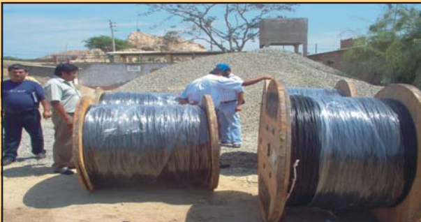
11500 m. lineales de cable para electrificación de Caseríos los Mimbelas y los Bancos en Túcume. monto: 48530 nuevos soles