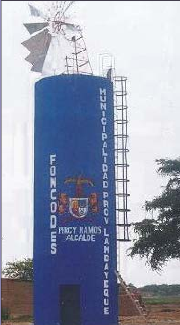
Imponente vista del pozo tubular accionado por un molino de viento en Capilla Santa Rosa

CONSTRUCCION DE POZO TUBULARES RESPUESTA OPORTUNA ANTE LA SEQUIA