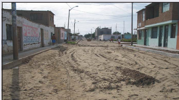
Antes de los trabajos, este es el aspecto que tenía esta importante arteria.

Las calles Pavimentadas son: Sebastián Oneto, Pascual Saco, Ángel Gonzáles, Prolongación José Gálvez, Pasaje Quiñones, Luis Heysen, y la Avenidas Andrés Avelino Cáceres.