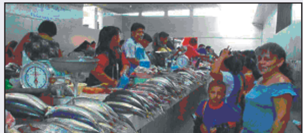
Remodelación de la sección Pescado en el Mercado Modelo, comprende construcción de techo, drenajes, piletas individuales para cada puesto, mejoramiento de baños y rehabilitación del sistema del agua y desagüe; monto de ejecución 55012 nuevos soles.