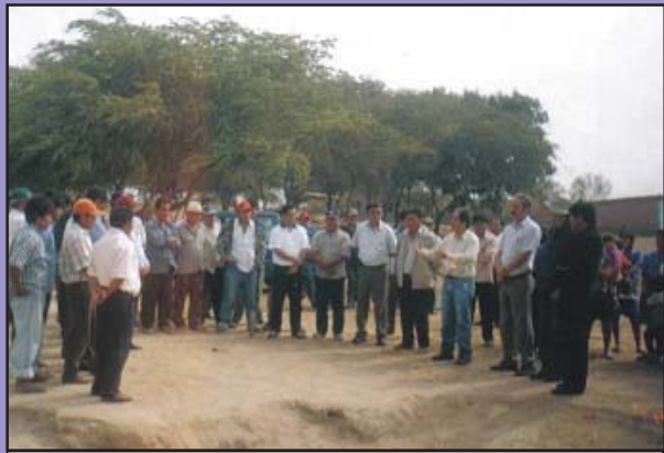
Antes de iniciar la Obra el Alcalde Percy Ramos muestra a los moradores del Caserío el terreno donde se edificará el Pozo Tubular.

Este caserío se vio beneficiado al inicio de esta gestión municipal, con la reconstrucción de la Plataforma Deportiva de su Centro Educativo, que por su mal estado se convirtió en un riesgo latente para los escolares, también se donó otros materiales para el acondicionamiento del colegio.