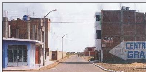
Calle Fernando Belaunde Terry, Pavimentación Flexible en una área de 1426 metros cuadrados, con una inversión de 56 400 nuevos soles.