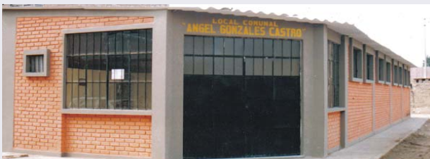
Construcción del moderno Local Comunal Angel Gonzales Castro, ubicada en la Urbanización progresiva Ramón Castilla; la inversión Municipal ascendió a 46050 soles.