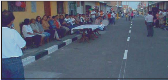
Calle Los Unidos Pavimentación Flexible que comprende las cuadras 1,2 y 3 área pavimentada y tiene un costo de 60 mil nuevos soles.