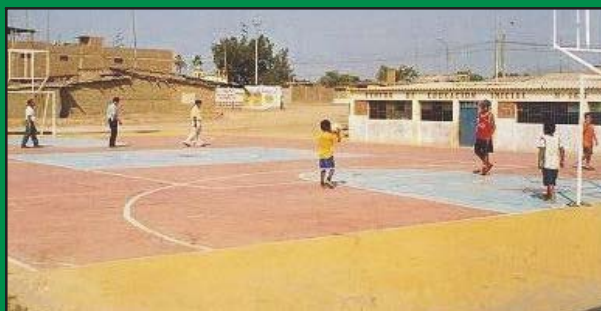
MPL construye Plataforma Jayanca

Esta obra se ejecuta como parte de la nueva política de inversión Municipal, donde la Comuna Provincial esta orientando parte de sus recursos a los distritos en los que antes no se invertían, las obras que efectúa la Municipalidad Provincial tiene como fin dar cobertura a las múltiples necesidades en los distritos que forman parte de la provincia Lambayecana.