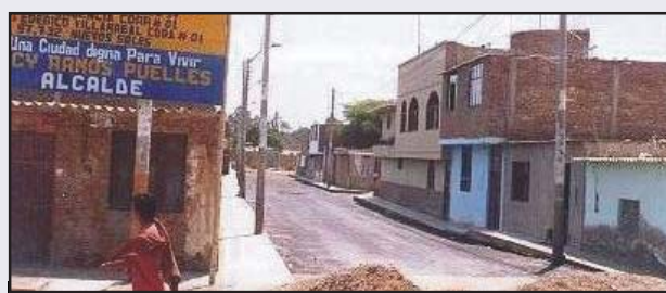
Asentamiento Humano Santo Toribio de Mogrovejo, Pavimentación Flexible y drenaje Pluvial, calles los Diamantes cuadra 17, Independencia cuadra1 y Federico Villareal cuadra 1; el monto de la Obra es de 97 700 nuevos soles.