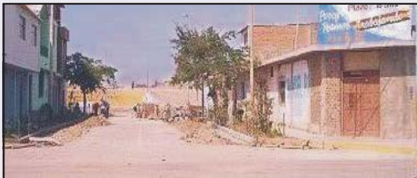
Calle Monjoy construcción de sardineles y ornamentación de jardineras, se invirtió 14 233.00 nuevos soles.

Cuando se desea realizar la Pavimentación de una Calle, Avenida, Local Comunal o cualquier otra Obra, Los Moradores se organizan en comité de gestión y hacen llegar sus pedidos y proyectos a la Municipalidad, prueba de ello son estas Obras que son una consecuencia de la Organización.