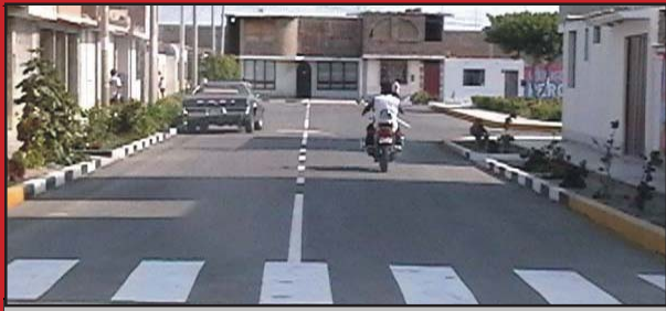
CALLE HIPÓLITO UNANUE