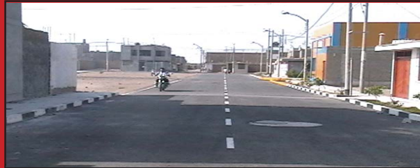
CALLE TORIBIO RODRÍGUEZ DE MENDOZA