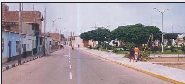
Calle Piura importante arteria del PP.JJ. San Martín en donde se Pavimento cuatro cuadras que cubren un área de 3850 metros cuadrados, adicionalmente se ha construido 1480 metros lineales de sardineles, inversión 220279 nuevos soles.