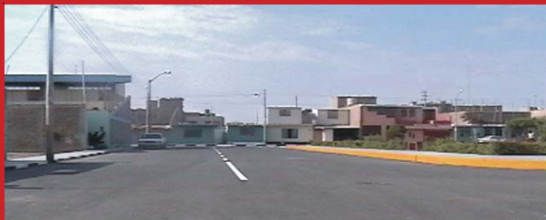
CALLE JOSÉ OLAYA