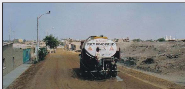
Calle Rivadeneira: importante arteria que se encuentra ubicado en el PP.JJ. Santa Rosa, Las Pavimentaciones que se ha ejecutado son las cuadras 4 y 5 la inversión es de 117 mil nuevos soles.