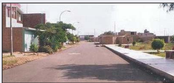
Calles: Prolongación Bacamatos cuadra 2 y Los Jazmines cuadra 1 - 2 comprende Pavimentacion flexible y cambio de Tuberías en el sistema de desague, inversión de 80 mil nuevos soles.