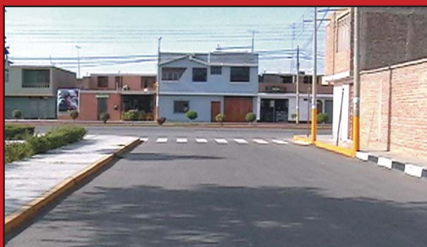
CALLE MARIA PARADO DE BELLIDO

En la Urb. Próceres de la Independencia primera etapa, se asfaltó 2,565 metros cuadrados