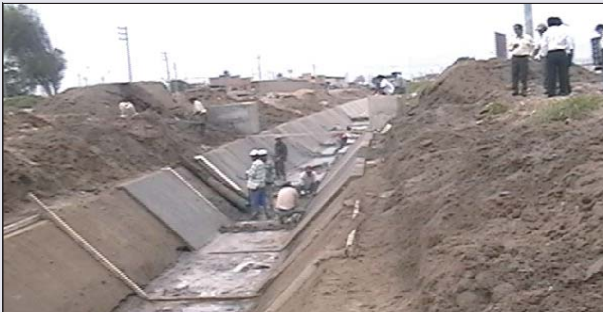
El Alcalde, Regidores y Funcionarios de la MPL inspeccionando los trabajos de mampostería que se realizan en el Canal San Rumualdo.

UN ANHELADO LOGRO LAMBAYECANO, TRAS MUCHOS AÑOS DE POSTERGACIÓN Y PROMESAS INCUMPLIDAS