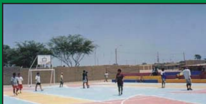
Construcción de loza Multideportiva ubicada entre la Prolongación Grau y Sucre en el PP.JJ. San Martín.

SE CONCLUYO REHABILITACION DEL ESTADIO MUNICIPAL CESAR FLORES MARIGORDA