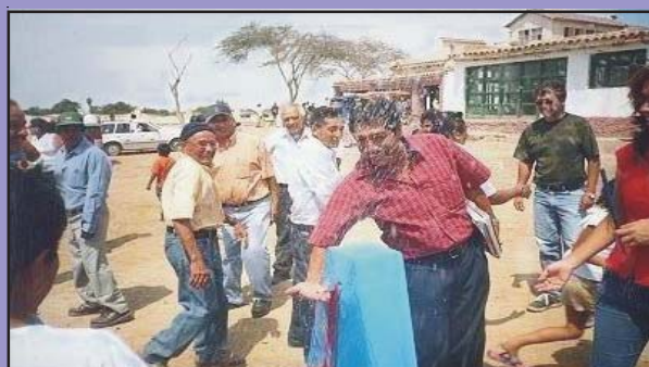
El Alcalde, su Esposa, Funcionarios y Pobladores «Disfrutando de un Baño» proporcionado por un complacido vecino del caserío.

INFORMES Y CONSULTAS Oficina de Relaciones e Imagen Institucional