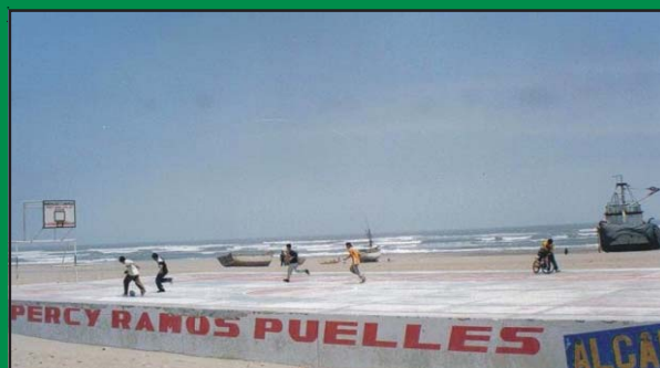
Ejecución MPL de la Plataforma San José

¡Cuando trabajamos juntos... nos hacemos más fuertes!