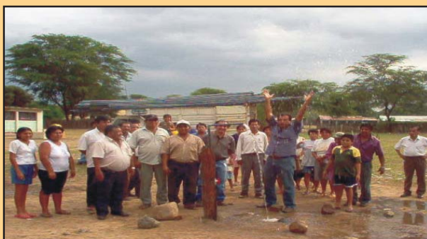
La MPL dono 2 kilometros de Tuberia para la isntalación de Piletas Publicas en el caserío de Ñaupe y en el anexo de Ñaupe Cautivo Olmos se beneficiarán mas de 300 familias