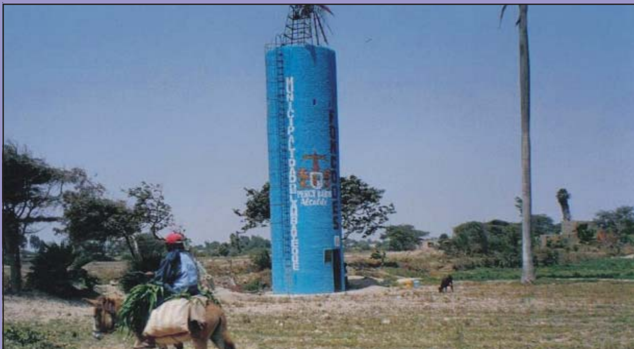
Toma panorámica del Pozo Tubular construido en Yencala Boggiano, Distrito de Lambayeque con una capacidad de 15 mil litros.

OTRO POZO TUBULAR RESUELVE ESCASEZ DE AGUA