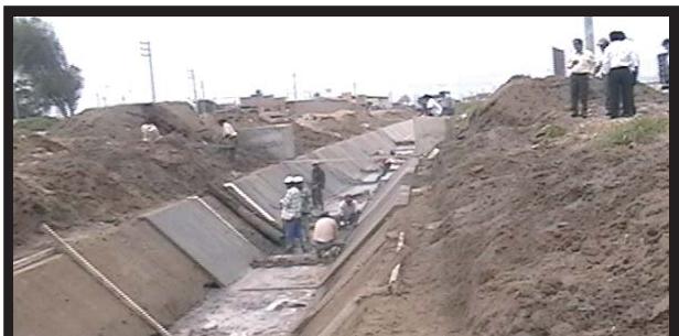
AMPLIAN TRABAJOS DE REVESTIMIENTO EN CANAL SAN RUMUALDO

MUNICIPALIDAD DE LAMBAYEQUE MEJORA EL ORNATO DE LA CIUDAD