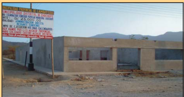
Edificación de un Comedor Popular en el distrito de Chochope valorizado en 25 mil nuevos soles