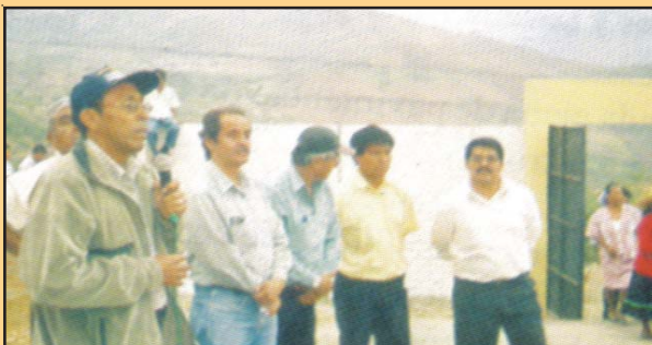
Uno de los Caseríos más alejados de la Provincia es Cachirca Distrito de Salas en donde la MPL construyó el cerco perimétrico de la Escuela Fiscal