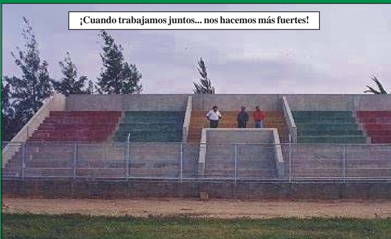
CONSTRUCCIÓN DE TRIBUNA SUR EN EL ESTADIO MUNICIPAL DE OLMOS.

¡Cuando trabajamos juntos... nos hacemos más fuertes!