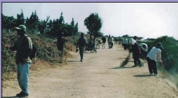
Trabajo de rehabilitación como este, se realizaron en la trocha carrozable para poder trasladar los materiales a la zona de trabajo desde la panamericana norte.