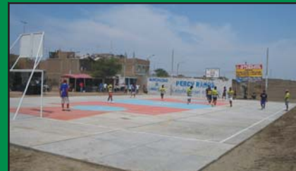
Loza Deportiva construida en el PP.JJ. Santa Rosa.

La Rehabilitación del primer escenario deportivo de nuestra ciudad consistió en el mejoramiento de los servicios higiénicos, Camerinos, Zonas de acceso a la tribuna oeste, un moderno sistema de riego por aspersión y drenaje.