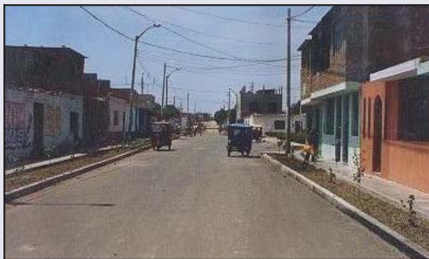
Nuevo aspecto que luce la Calle Sebastián Oneto en el AA.HH. Toribia Castro.