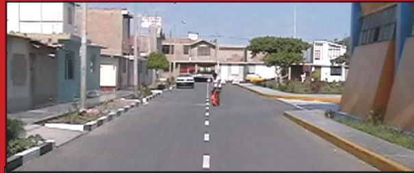
CALLE FRANCISCO DE ZELA