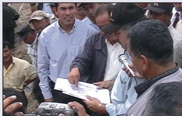
El Alcalde Lambayecano detallando al Ministro de Agricultura los pormenores de la ejecución del Canal San Rumualdo.