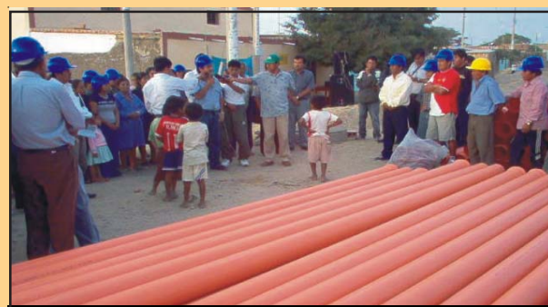
Ampliacion del alcantarillado en el AA.HH. Ritche Prada - Morrope ejecutada en 2 etapas; monto de inversion S/. 30 152.70