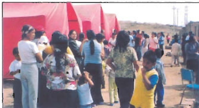
Personal médico se traslada a los lugares más alejados, donde son esperados por pobladores de A.A.H.H. para ser atendidos gratuitamente.