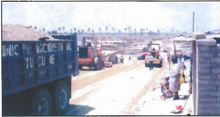
Maquinaria pesada de la MPL que se empleó en la construcción de las nuevas vías de acceso en el AA.HH. Primero de Marzo «Las Dunas».