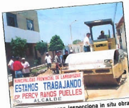
Alcalde Lambayecano inspecciona in situ obras de asfaltado y construcción de sardineles en el pueblo joven «San Martín».