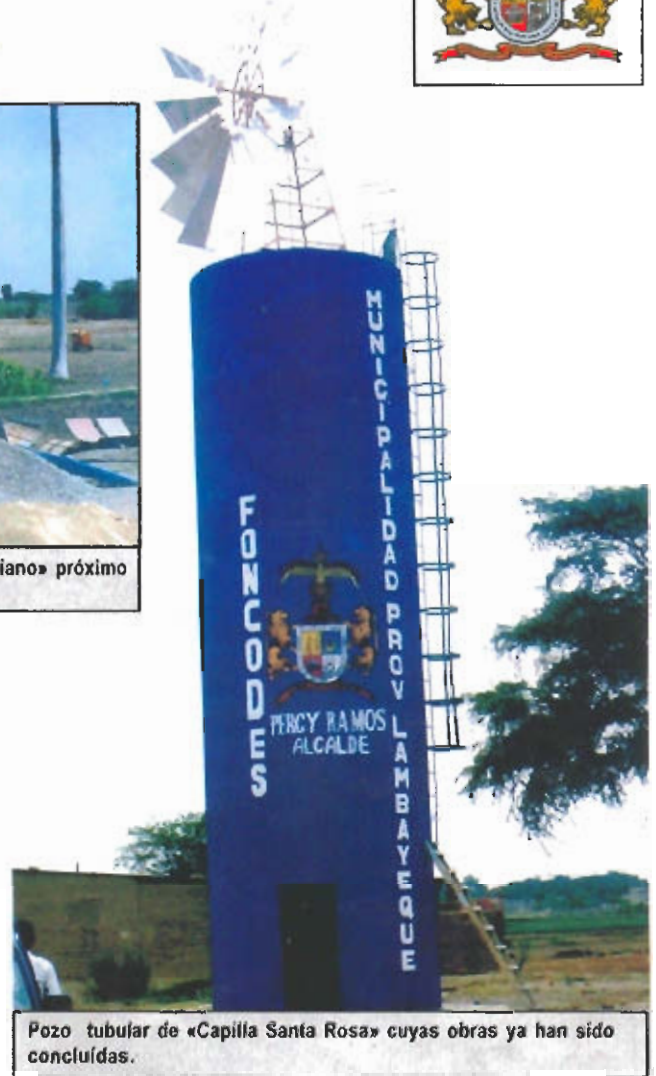
Pozo tubular de «Capilla Santa Rosa» cuyas obras ya han sido concluidas.

Los trabajos que se realizan en los distritos y caseríos de la provincia son un logro en el difícil camino de la descentralización. Esta nueva política de gestión que ha emprendido la actual administración edil, es para beneficiar a las comunidades en sus necesidades básicas y dar inicio a una verdadera y auténtica integración y revertir el actual sistema asfixiante, donde la injusticia y el olvido es parte activa de la dura realidad de los pobres.