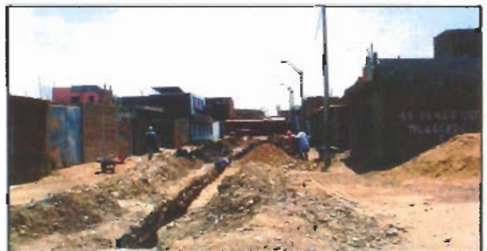
Ampliación de redes de agua y desagüe en la cuadra 1 de la Calle Manco Cápac, trabajos que se realizan con presupuesto municipal.