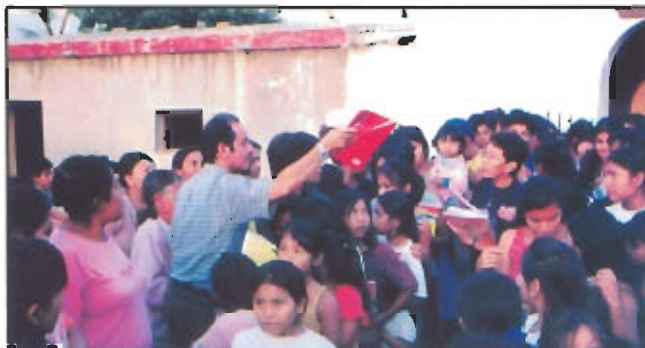
Ante la expectativa general de padres de familia y alumnos el alcalde Percy Ramos hace entrega de útiles escolares.