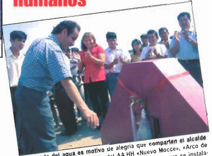
La llegada del agua es motivo de alegría que comparten el alcalde lambayecano y los pobladores del AA.HH «Nuevo Mocce», «Arco de Villa» y «Las Dunas»; las piletas de servicio público que se instalaron fueron 6.

La Municipalidad Provincial de Lambayeque intensifica trabajos en los pueblos jóvenes y asentamientos humanos para dotarlos de los servicios básicos.