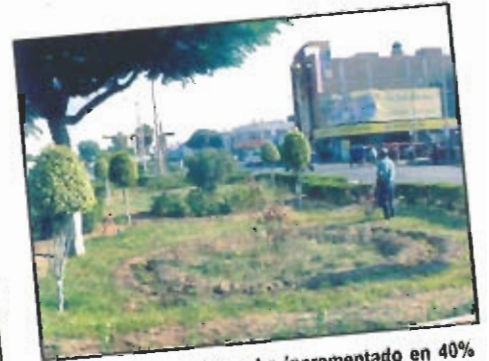
En la actual gestión se ha incrementado en 40% las áreas verdes, la preocupación de las autoridades es seguir desarrollando programas que permitan multiplicar las áreas existentes.