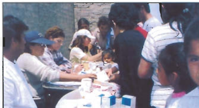
Miembros del Comité de Damas hacen entrega gratuita de medicinas a los pacientes luego de ser atendidos.