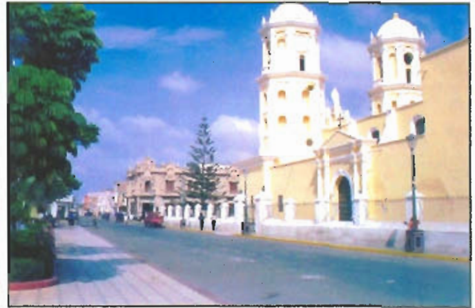
Imponente vista de nuestra histórica catedral y Palacio Municipal.

Se calcula que en los 10 días que duró la feria asistieron más de 50 mil personas.