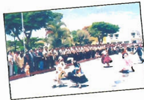
Los tradicionales desfiles de los días Domingos son motivo para que las principales instituciones educativas y culturales de nuestra provincia puedan dar muestras de sus dotes artísticas e identificación con nuestra cultura.

El Comité de Damas de la MPL organizó una gran bicicleteada, en la cual participaron las integrantes de los comités del Vaso de Leche. La ganadora se hizo acreedora a una bicicleta montañera.