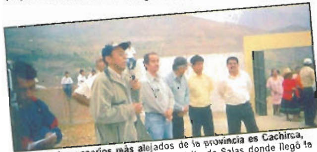
Uno de los caseríos más alejados de la provincia es Cachirca, ubicado en las serranías del distrito de Salas donde llegó la ayuda de la MPL en la construcción del cerco perimétrico de la Escuela Fiscal.

En la vista fotográfica apreciamos el caserío Punto Cuatro, el que pronto contará con el servicio de electrificación, para ello la MPL viene interconectando desde el distrito de Mochumi (5 km) la red primaria valorizada en 176 mil N. soles, que comprende la colocación de postes, cables de alta tensión y transformadores, entre otros componentes, para luego proceder a la instalación de la red secundaria a un costo de 79 mil N. soles, que consiste en instalar el servicio domiciliario. Esta inversión municipal beneficiará adicionalmente a los caseríos aledaños de Punto Cuatro, por lo que se califica este primer paso como el inicio de un nuevo programa municipal de electrificación rural en beneficio de las comunidades campesinas que por décadas han estado al margen de los servicios básicos.