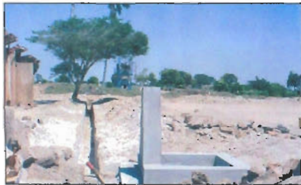
Vista general de una de las piletas en construcción en el caserío «Yéncala - Boggiano», al fondo se observa el pozo tubular que la abastecerá. En este lugar se han instalado 9 piletas similares.