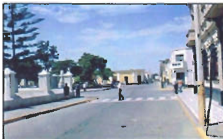
Lambayeque es la primera provincia en el Perú que cuenta con un plan de acondicionamiento urbano y territorial.

Resultado de estas propuestas es el programa de inversiones prioritario que se sintetiza en 60