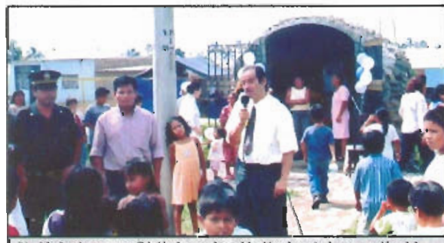
Alcalde lambayecano dirigiéndose a la población durante inauguración del Parque «14 de Febrero» y capilla en el Pueblo Joven «Las Dunas»