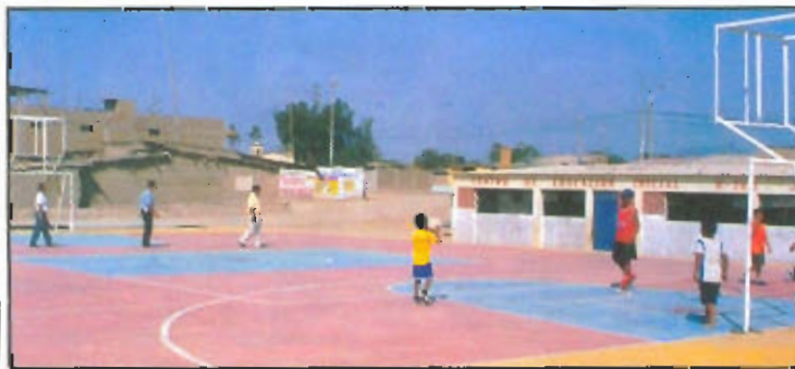
Losa deportiva en distrito de Jayanca, prontamente será inaugurada.

La Municipalidad Provincial de Lambayeque en lo que va de la gestión ha entregado cuatro plataformas multideportivas, la que apreciamos en la vista está ubicada en el distrito de Jayanca.