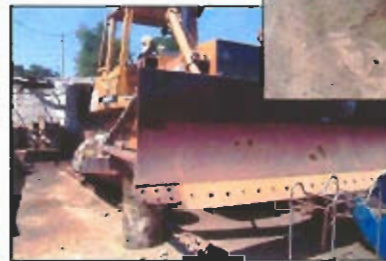
Luego de su refacción, el tractor de oruga realiza diversos trabajos en zonas urbano - marginales.