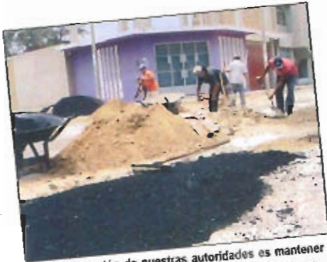
La preocupación de nuestras autoridades es mantener en óptimas condiciones las diferentes arterias de nuestra ciudad.