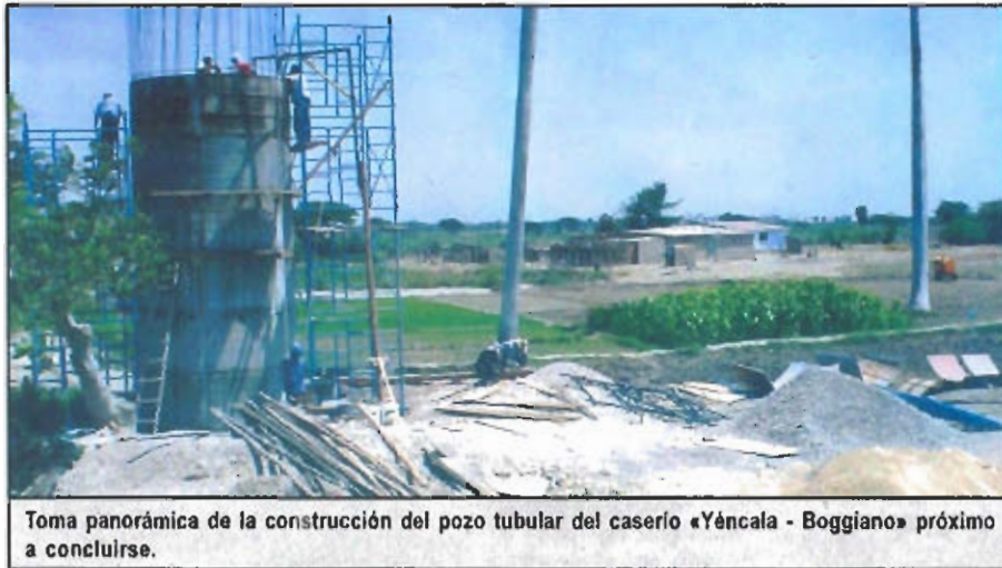
Toma panorámica de la construcción del pozo tubular del caserío «Yéncala - Boggiano» próximo a concluirse.