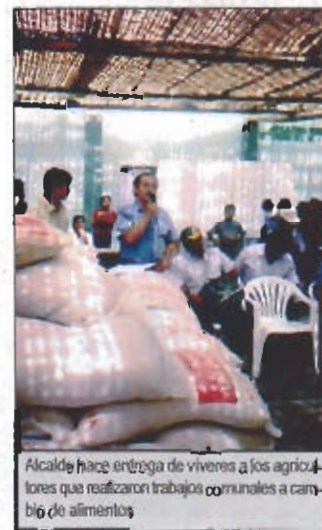
Alcalde hace entrega de viveres a los agricultores que realizaron trabajos comunales a cambio de alimentos.

También se ha previsto la difusión de información de las principales disposiciones y comunicados emitidos oficialmente, los montos de las adquisiciones de los bienes y servicios, los proveedores y la cantidad y calidad de bienes; así como todo el quehacer municipal a través de la Internet.