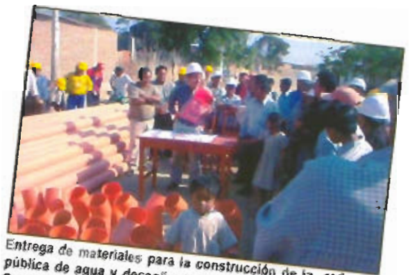
Entrega de materiales para la construcción de la red pública de agua y desagüe en el pueblo joven Ritcher Prada de Mórrope.

Las obras incluyen la construcción de cancheros para los deportistas y árbitros, además cuenta con servicios higiénicos y su ubicación es en la zona sur del recinto deportivo teniendo una capacidad proyectada para recibir a mil espectadores cómodamente instalados.