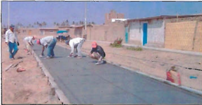
Trabajadores de la zona, empleados en la construcción de veredas.

Vecinos de Nuevo Moece, pueblo joven San Martín y Las Dunas fueron beneficiados con la construcción aproximada de 20 mil metros cuadrados de veredas de concreto, lo que fue calificado como un récord nacional en el 2003.